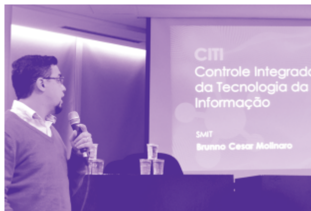
Apresentação da implantação de sistemas de código aberto para Gerenciamento de Ativos de TI em órgãos da Prefeitura.

O sistema de Gestão de Demandas, inventário de ativos de TIC e licenças de software apresentado pelo líder de TIC da Secretaria Municipal de Inovação e Tecnologia, batizado de CITI (Controle Integrado de Tecnologia da Informação), foi disponibilizado e adotado por 8 órgãos do Sistema Municipal de Tecnologia da Informação e Comunicação.